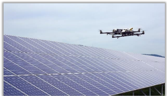
© AscTec Falcon 8 en pleine opération d'inspection de panneaux photovoltaïques

Dans l'éolien aussi, les drones sont de plus en plus utilisés. L'accès au niveau des pales rend l'usage d'un drone essentiel, au regard de la rapidité de mise en œuvre, d'inspection (autour de deux heures pour un mât et les pales), la réduction des risques pour les intervenants et des coûts. En outre, les images photos et vidéos instantanément disponibles donnent la possibilité d'envoyer à l'exploitant l'état de ses éoliennes. Quant au solaire, de plus en plus d'exploitants recourent à des drones munis de caméras thermiques infrarouges afin de localiser rapidement des défauts potentiels au sein de la cellule ou détecter des problèmes d'interconnexions électriques.